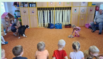
Navštěvují nás divadla a umělci