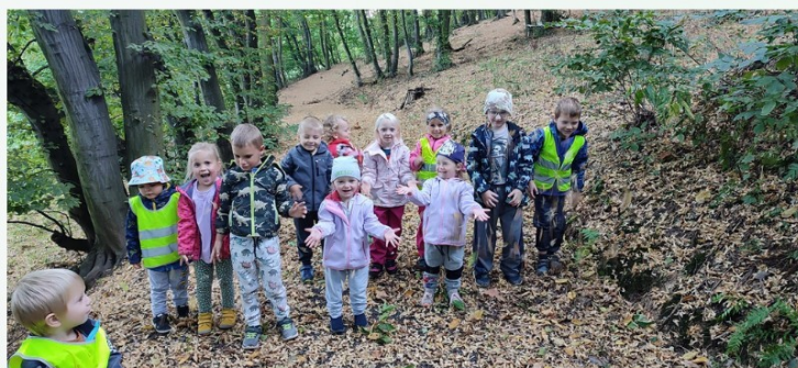
Často jsme v lese, nebo na loukách