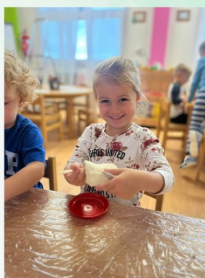
Tvoření ze slaneého těsta

Děti přirozeně moc rády cokoli tvoří a vyrábí, různými výtvarnými technikami tak objevují svět kolem nás.